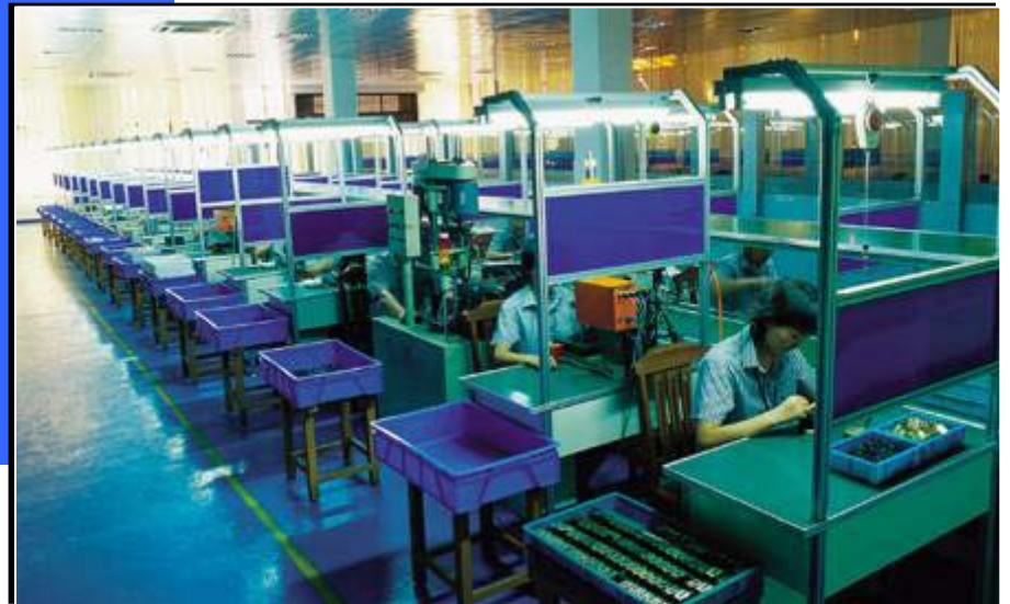
摩托车仪表生产装配流水线